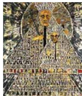
MONIQUE APPLE Vierge noire Technique mixte (bois, ardoise, coquille d'huître, cailloux, papier maché, mastic, peinture, collages.)